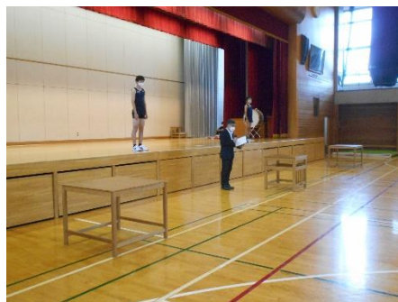
校長先生からのエール