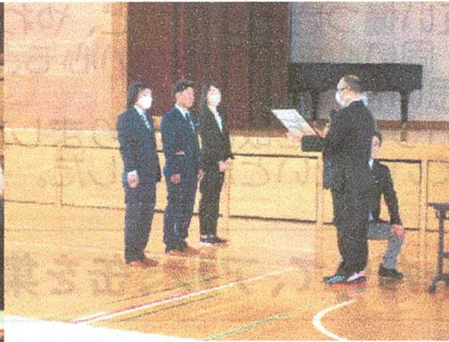
旧役員の方々へ感謝状贈呈