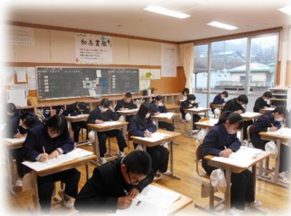
1年1組テストの様子