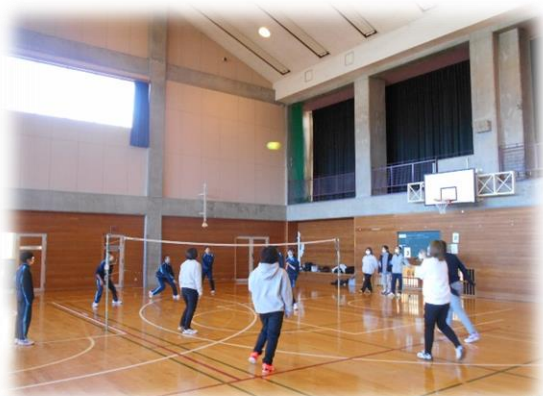
1 学年 親子レクの様子①

2月16日（金）には今年度最後の授業参観、学年学級 PTA がありました。年間4回の参観日でしたが、今回もたくさんのご出席ありがとうございました。最終回は1学年が学年レク（バレーボール）に参加していただき、2学年は救急救命講習会、3学年は1組が家庭科、2組が美術科の様子をみていただきました。