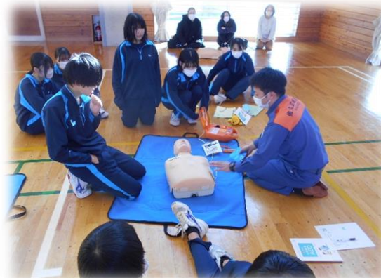
救急救命講習会の様子②