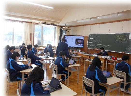
3 年 2 組 美術科 思い出のアルバムづくり