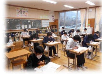
2年1組テストの様子