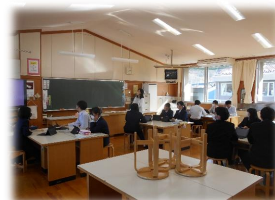
3 年 1 組 家庭科 お弁当を作ってみよう