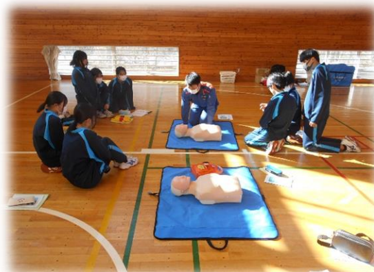
2 学年 救急救命講習会の様子①