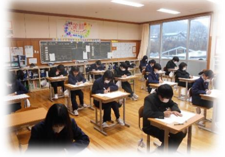
2年2組テストの様子