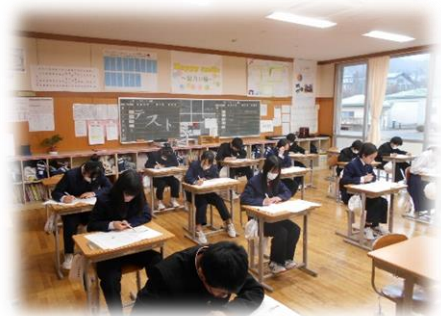
1年2組テストの様子