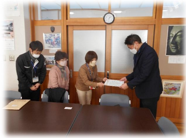
人権擁護委員の方より賞状を受け取る学校長

小海中は人権教育の時間をとても大切にしています。来年度も人権感覚を磨いていけるような授業を継続して行っていきたいと思います。